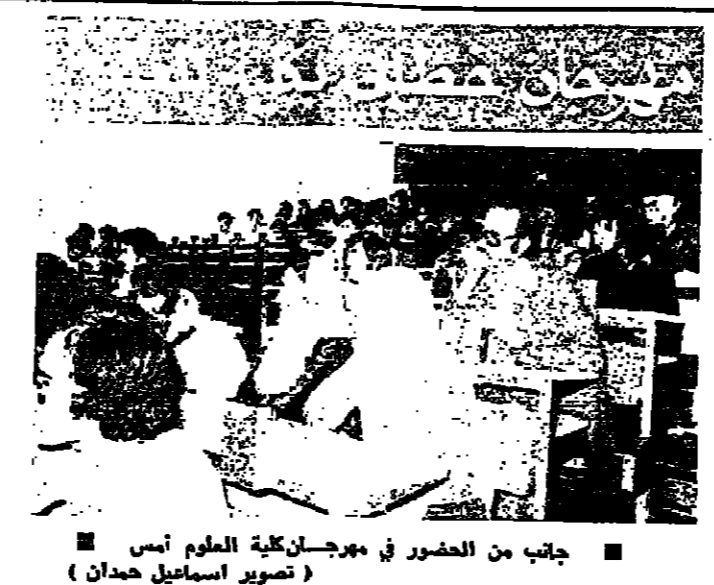
جانب من الحضور في مهرجان كلية العلوم أمس

الوزراء لا يتوقعون - تنمة رؤيد هذا الاتجاه السيد كسبال جناب الذي فخر بيروت في رحلة استجمام قصيرة ، ومعتبر ان السلطة غير واردة في وقت قريب ، وان الرجوع المينة لم طرح بعد موضوع تعديل المينة على بساط البحث ، ويعتقد في نيتها طرحه في ظل الاجراء الاستثنائي